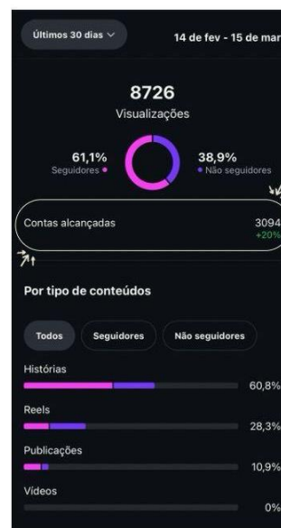
março de 2025