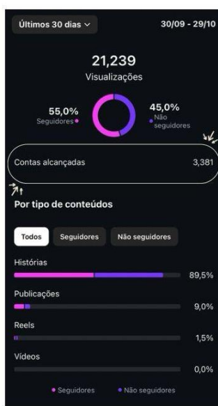
outubro de 2024